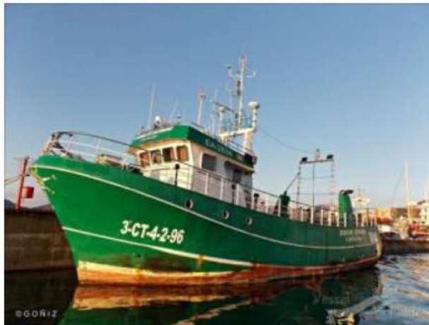
El barco "Ciudad de Cartagena" (Imagen 1 (antes de la remodelación) y 2 (después), que es un arrastreo retirado de la pesca desde el año 2014, ha sido remodelado para actuar como

Las actividades alternativas a la pesca que se evalúan en el proyecto MEDGuard han sido propuestas por un grupo de emprendedores, entre los cuales se encuentran pescadores e hijos de pescadores, y se engloban entre las siguientes: actividades turísticas, recogida de residuos sólido flotantes, recogida de redes perdidas y monitorización de parámetros ambientales.